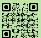
公開講座ホームページ