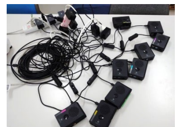
小型コンピュータ (Raspberry Pi)