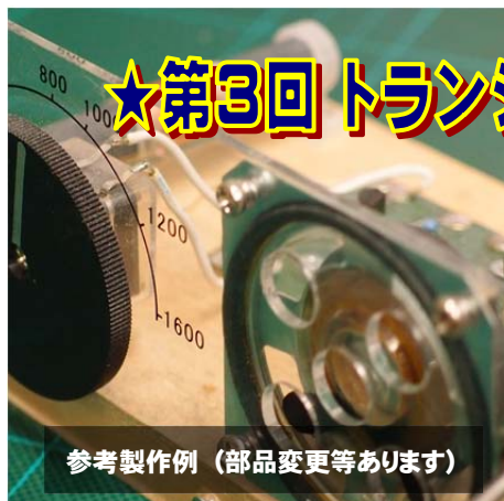
参考製作例 (部品変更等あります)