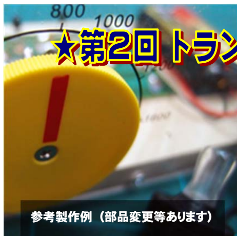
参考製作例 (部品変更等あります)